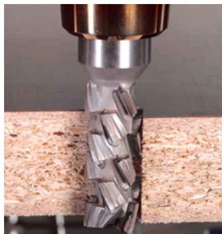
Diamaster PRO 3 (links) – de eerste keuze bij het formatteren van nestingsmachines en batchgrootte 1-systemen.